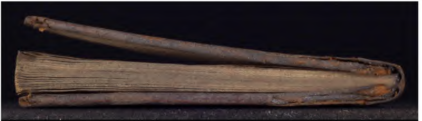
Early European Books, Copyright © 2012 ProQuest LLC. Images reproduced by courtesy of The Wellcome Trust, London. 4041/A/2